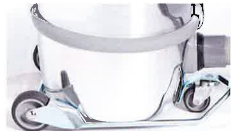
グレーチング対応の大型タイヤ装着トrolley(オプション)